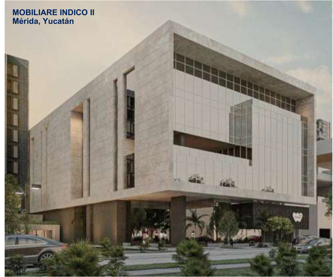
MOBILIARE INDICO II Mérida, Yucatán