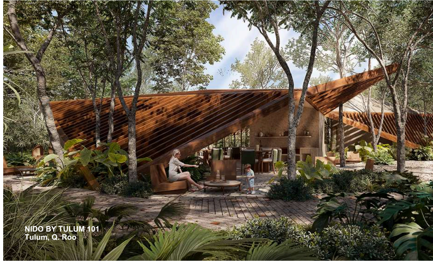
NIDO BY TULUM 101 Tulum, Q. Roo