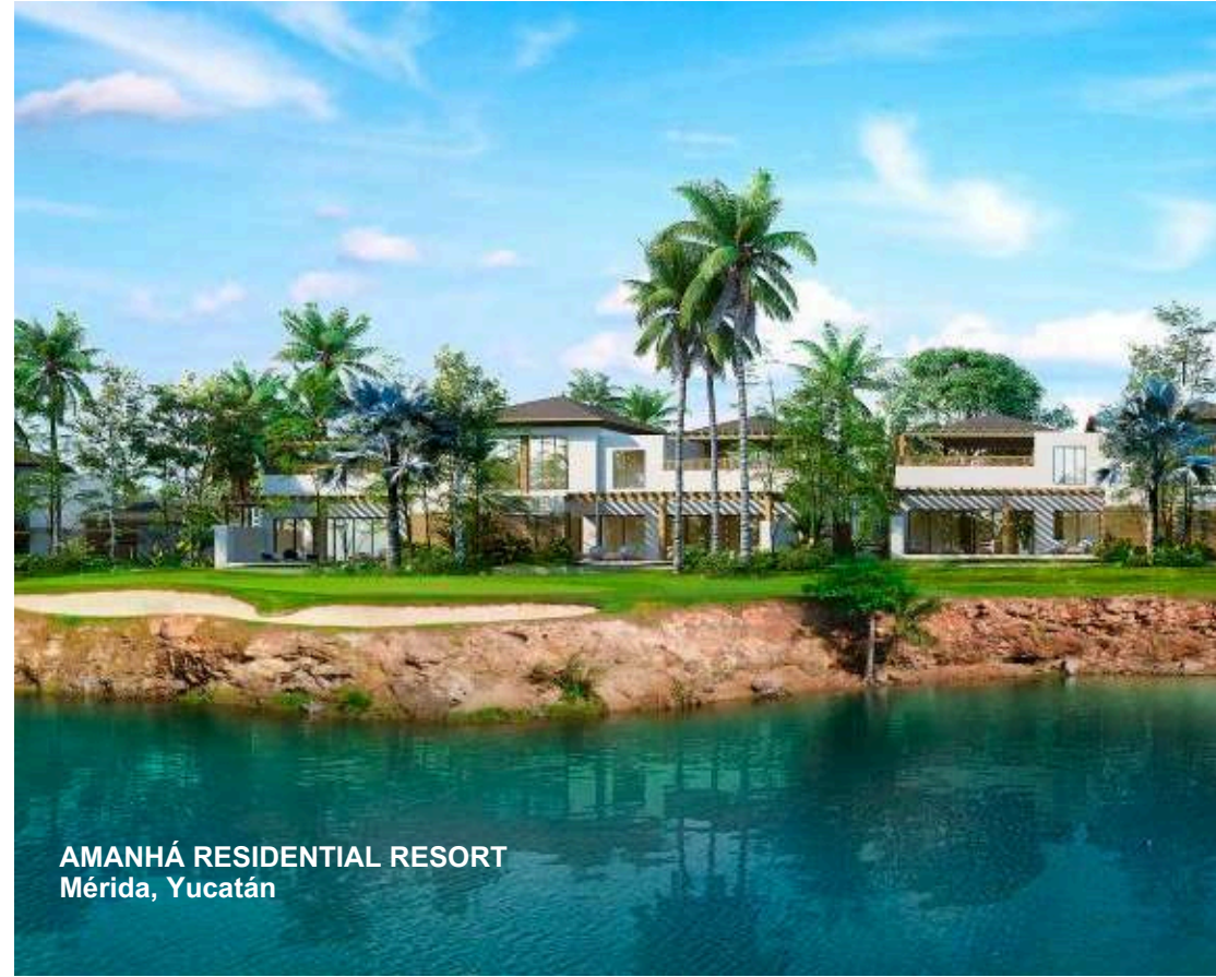
AMANHÁ RESIDENTIAL RESORT Mérida, Yucatán