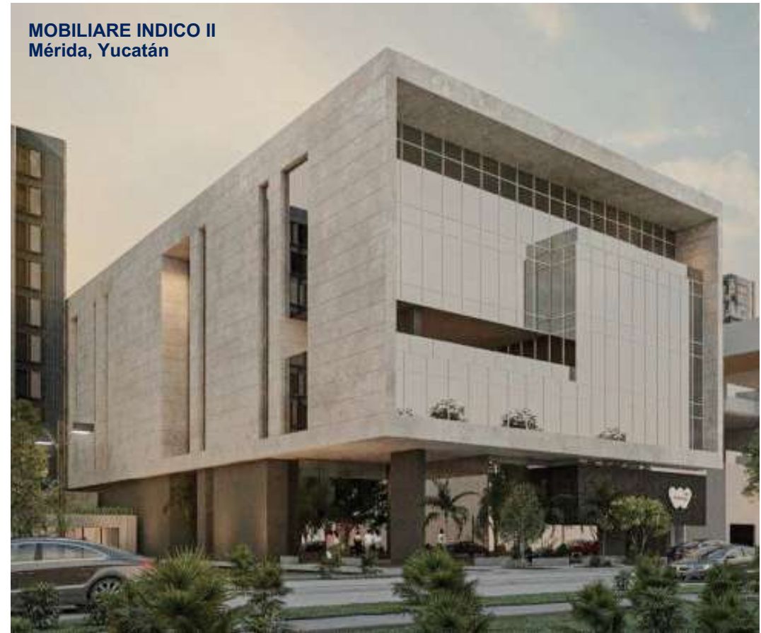
MOBILIARE INDICO II Mérida, Yucatán