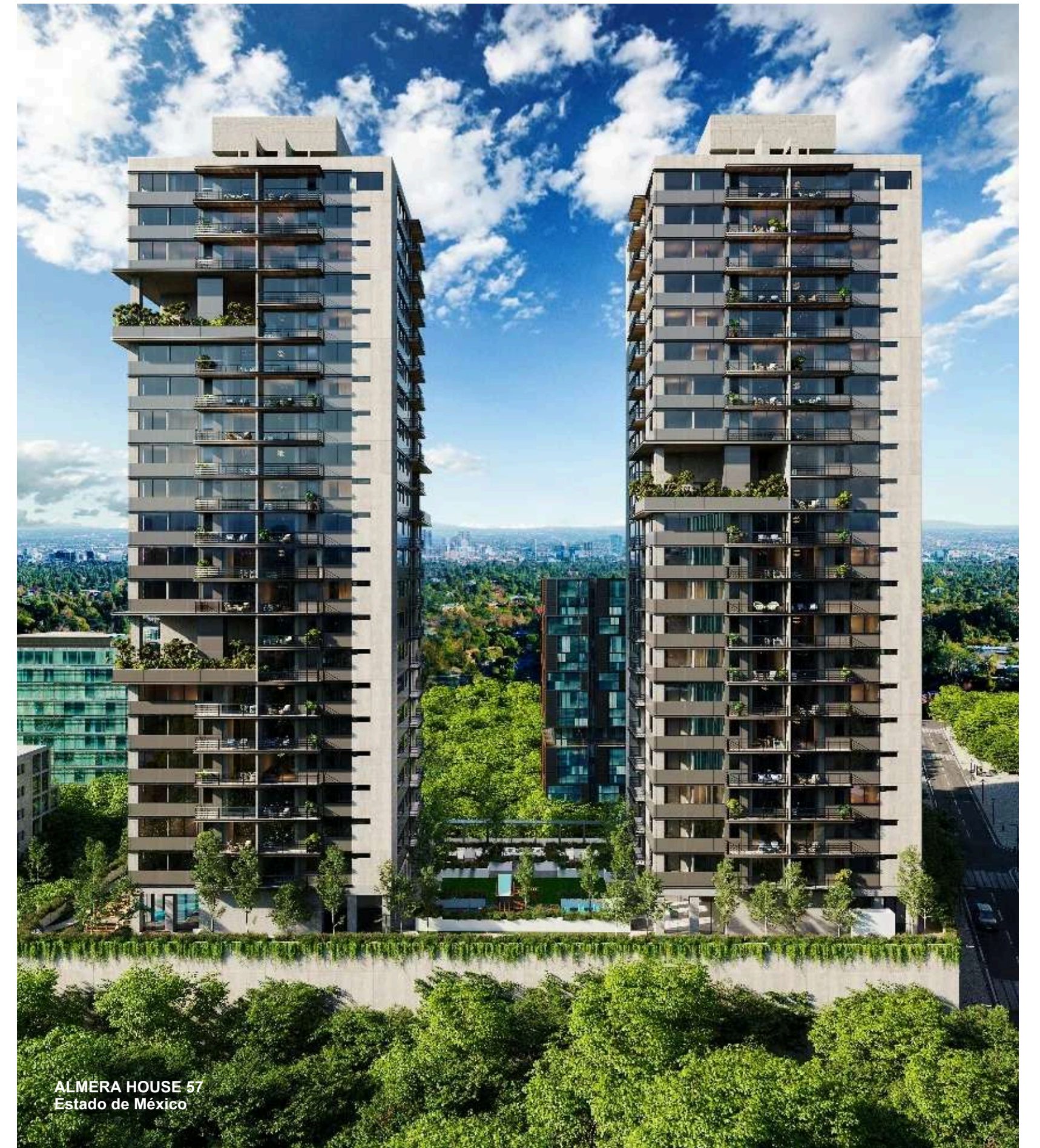
ALMERA HOUSE 57 Estado de México