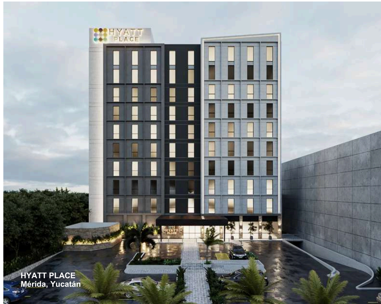
HYATT PLACE Mérida, Yucatán