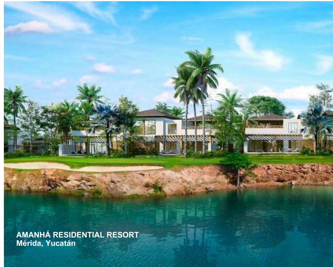
AMANHÁ RESIDENTIAL RESORT Mérida, Yucatán