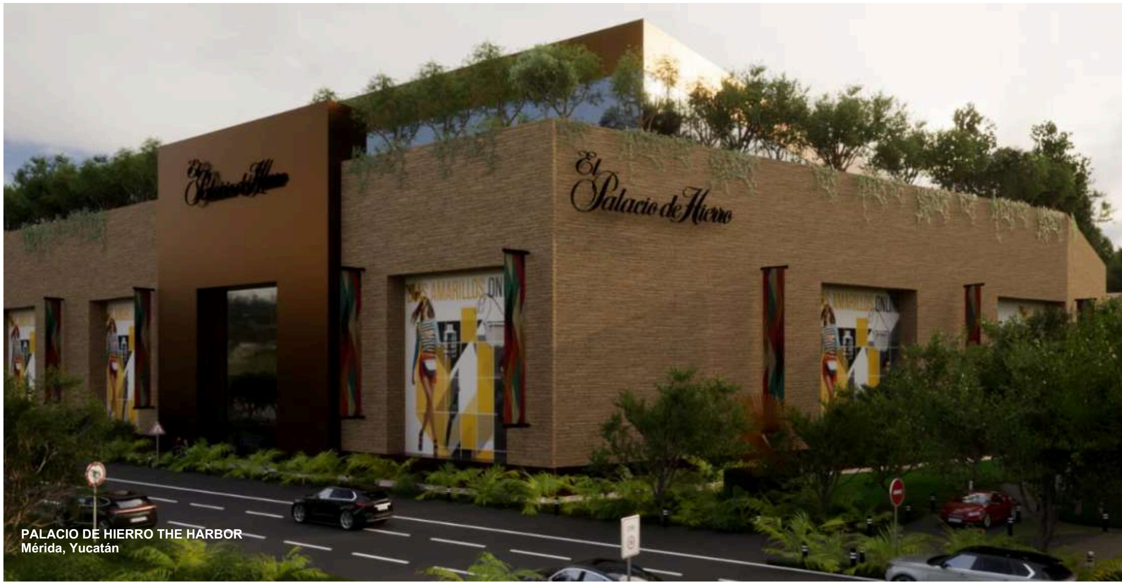
PALACIO DE HIERRO THE HARBOR Mérida, Yucatán