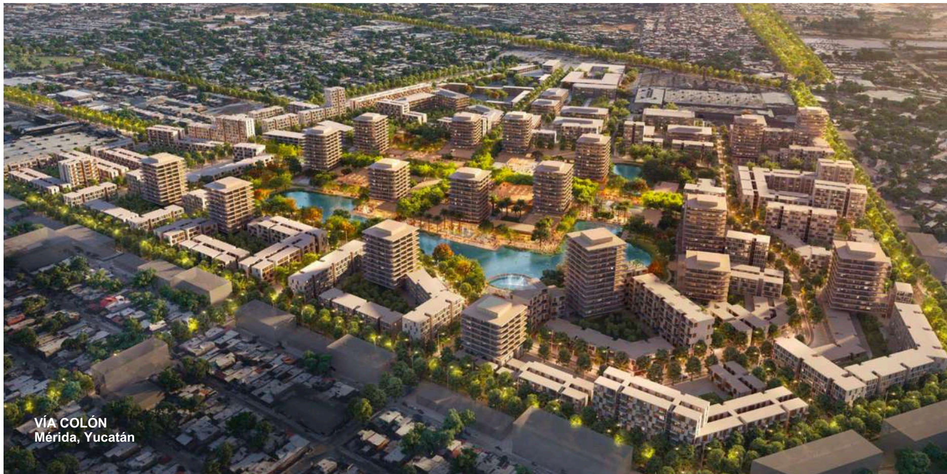
VÍA COLÓN Mérida, Yucatán