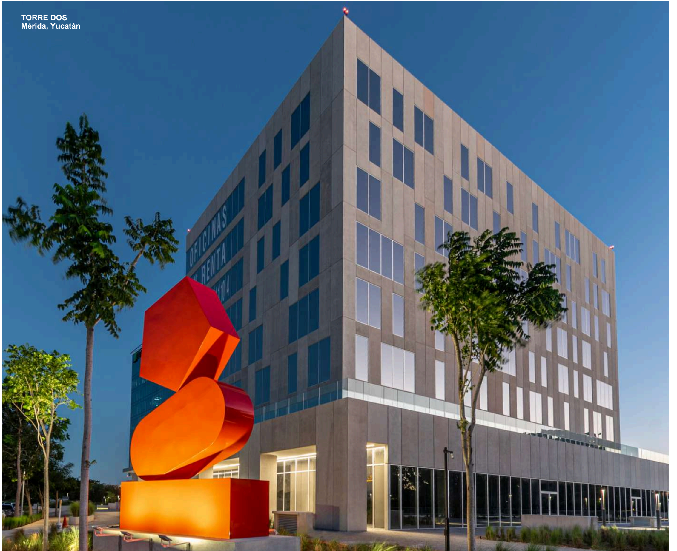
TORRE DOS Mérida, Yucatán