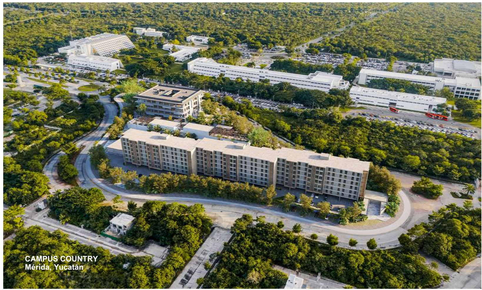
CAMPUS COUNTRY Mérida, Yucatán