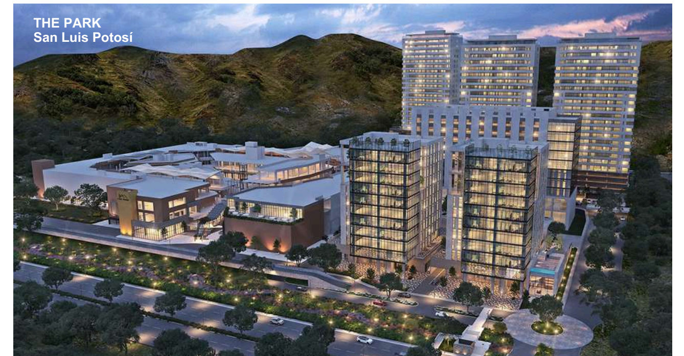
THE PARK San Luis Potosí