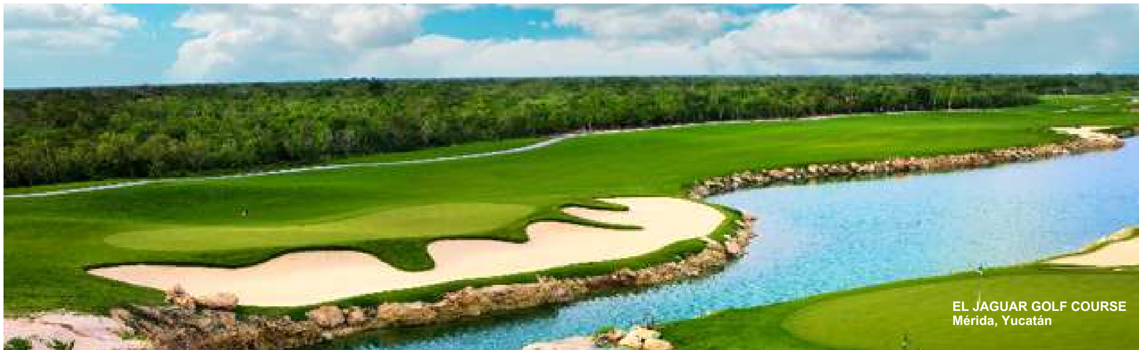
EL JAGUAR GOLF COURSE Mérida, Yucatán