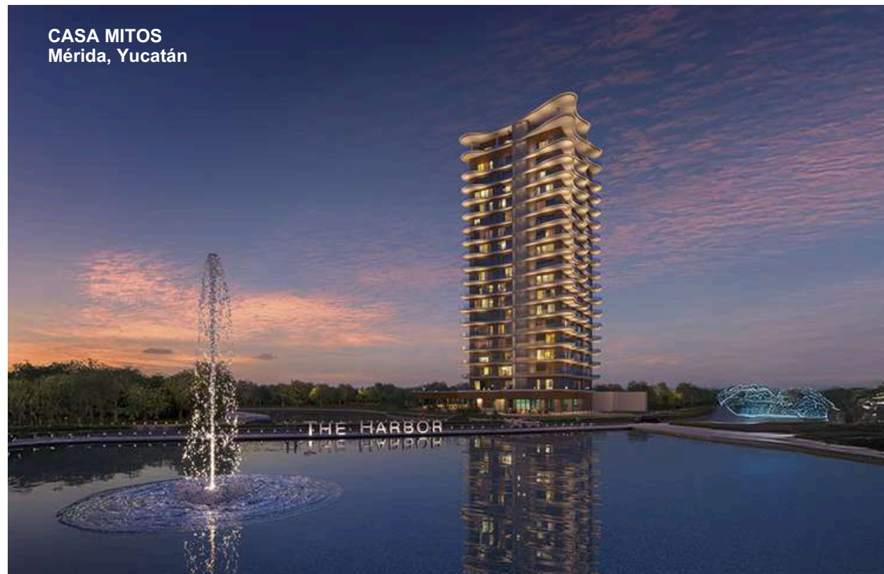
CASA MITOS Mérida, Yucatán