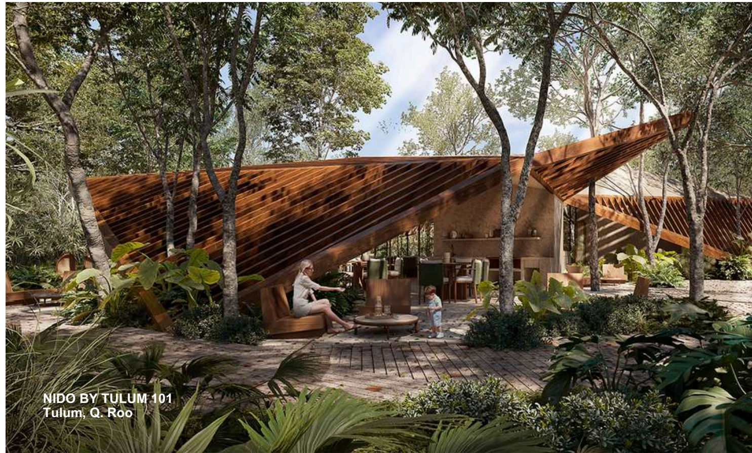
NIDO BY TULUM 101 Tulum, Q. Roo