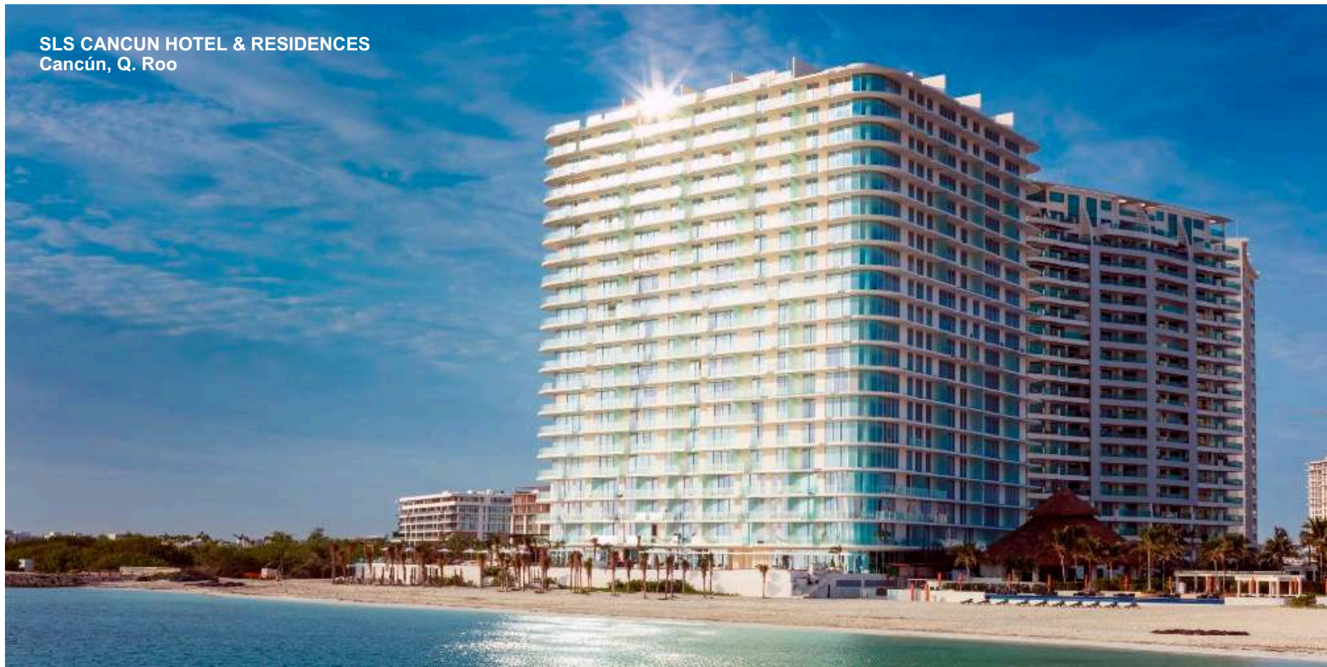
SLS CANCUN HOTEL & RESIDENCES Cancún, Q. Roo