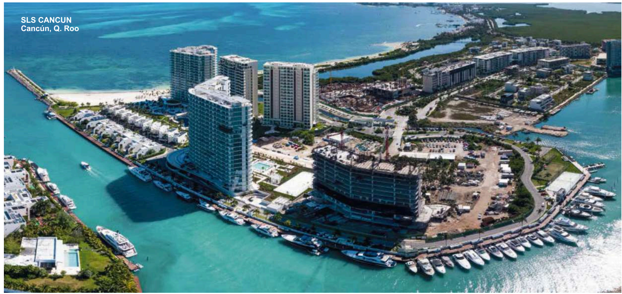
SLS CANCUN Cancún, Q. Roo